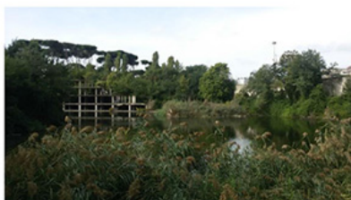
Lago ex Snia (unico lago naturale di Roma)