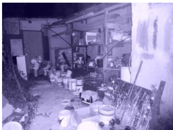
la raccolta di barattoli di vernice

“Siamo ancora semi anonimi. Ma alla fine, siamo obbligati a mettere la faccia. D'estate, non ce la fai a non farti vedere, perché le persone si affacciano alle finestre o passano più tempo fuori casa. Addirittura, a volte, devi chiedere a queste persone di chiuderle, per poter lavorare ! E poi, non possiamo uscire troppo tardi, la mattina lavoriamo tutti e non possiamo fare le ore piccole!”