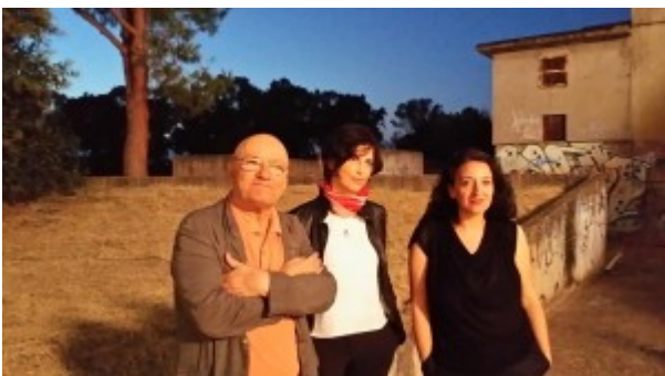
di Tommaso Capezzone)