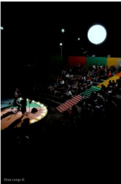
la luna in cielo