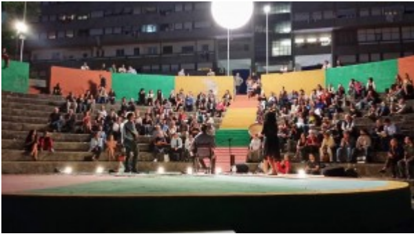
Canio comincia con la musica