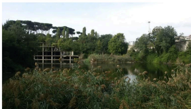
Lago ex Snia (unico lago naturale di Roma)